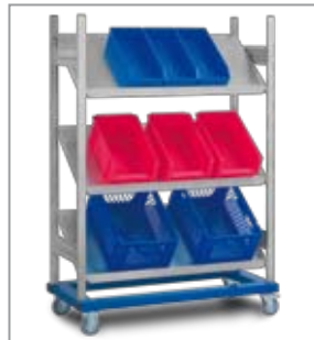
Schrägbodenwagen auf Anfrage.