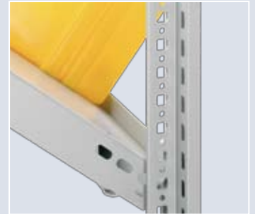
Traverse mit vorderer Anschlagkante (ca. 15 mm hoch)